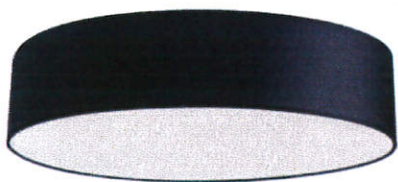
Stylowy nowoczesny plafon LIVO Ø 40 czarny