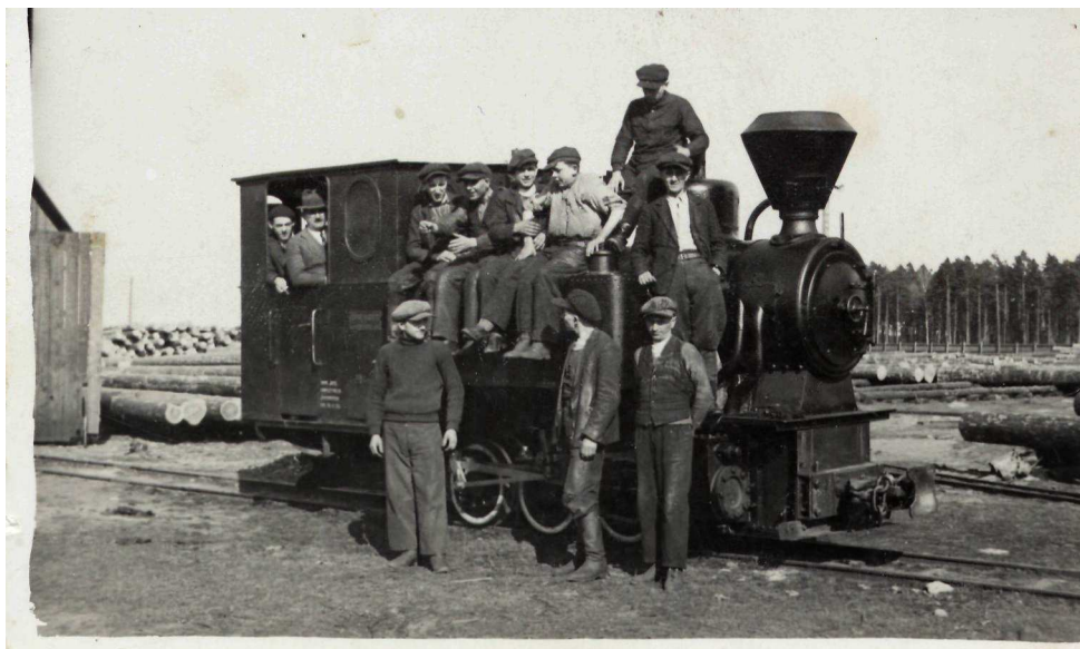
Obok zdjęcie „Lokomobili” kolejki leśnej z charakterystycznym „iskrołapem” na kominie

Początek lat trzydziestych to dalszy rozwój Miejscowości i początek nowoczesnego budownictwa dla stałej obsługi zakładu. Lasy Państwowe budują willę i budynek gospodarczy dla kierownika tartaku, dwa tzw. czworaki dla ośmiu rodzin urzędników i trzy bloki sześciopokojowe dla technicznej obsługi zakładu. Do końca lipca 1938 roku wszystkie budynki zostały zasiedlone. Ponad to w bezpośrednim sąsiedztwie zakładu, wybudowana została świetlica- kasyno. Okazały, stanowiący wizytówkę Dalekiego i okolic, budynek o konstrukcji drewno- murowanej (zdjęcie poniżej) spełniał funkcję: świetlicy, stołówki, Sali teatralnej i kinowej, pomieszczeń do zajęć klubowych i organizacji imprez turystycznych. Tu był przygotowany i rozpoczęty, każdy rajd turystyczny.